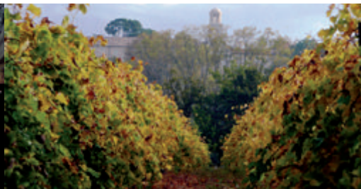
Vignes à Saint-Didier