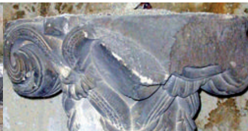
Un chapiteau de la cathédrale romane de Carpentras (bibliothèque Inguimbertine, archives et musées de Carpentras)