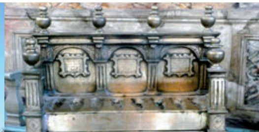
La lampe de Hannouka de la synagogue de Carpentras

Laissez-vous conter Noël! Circuits en bus des crèches du Comtat Venaissin (détails p.2)