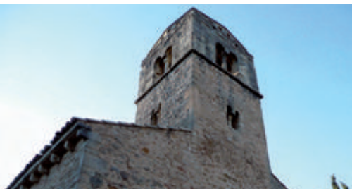
La chapelle de la Madelène à Bédoin