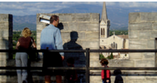
Visite à la Porte d'Orange de Carpentras