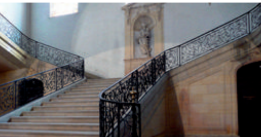
Les escaliers de l'Hôtel-Dieu de Carpentras