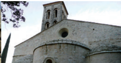
La chapelle Notre-Dame d'Aubune à Beaumes-de-Venise