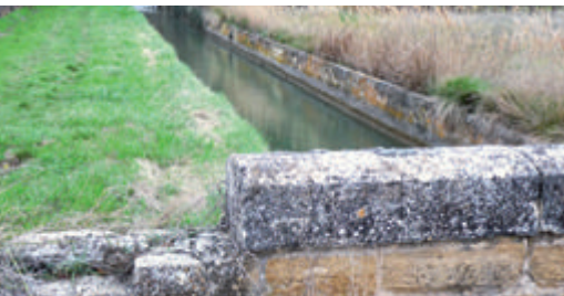
Pont sur le Canal de Carpentras