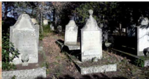
Le cimetière juif de Carpentras