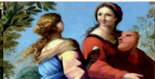
Peinture de Romanelli au Palais de Justice de Carpentras

À la découverte des terres cachées à l'origine des vins de Saint-Didier Rando-patrimoine le samedi 23 octobre 2010 à 15 h