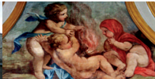
Les angelots d'hiver de la pharmacie de l'Hôtel-Dieu de Carpentras