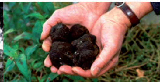
Truffes noires du Comtat