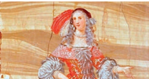
Portrait de Madeleine Béjart