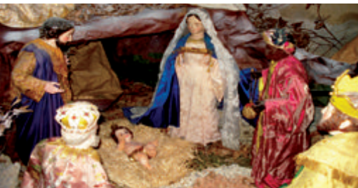
La crèche de l'église de l'ermitage de Saint-Gens au Beaucet