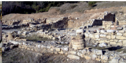
La villa antique des Bruns à Bédoin